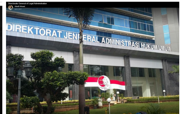
kantor ditjen ahu